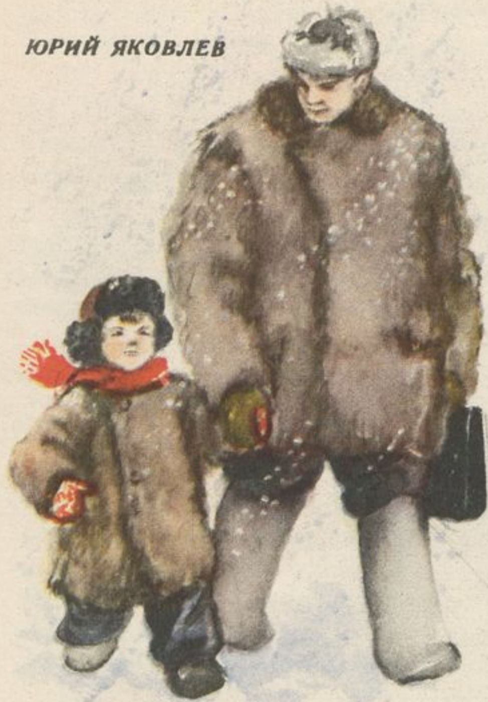
Рис. М. БУТРОВОЙ